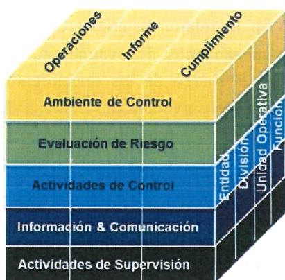
Esquema 1. Cubo COSO. Componentes

La evaluación fue realizada a los cinco componentes del COSO: